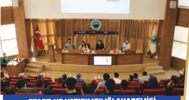
START-UP YATIRIMCILIĐI AKADEMİSİ