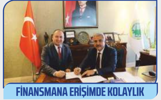
FİNANSMANA ERİŞİMDE KOLAYLIK