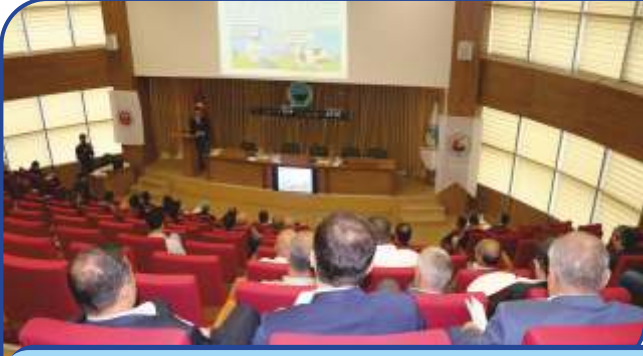
"TAŐINIR REHİNİ" BİLGİLENDİRME TOPLANTISI