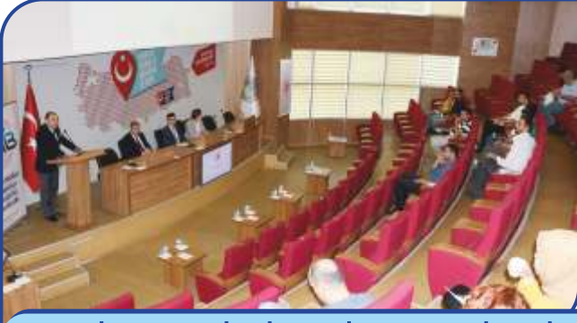
DIŐ TİCARET BİLGİLENDİRME SEMİNERİ