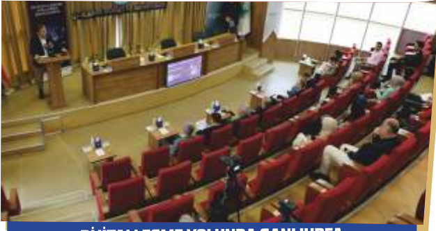
DIJİTALLEŞME YOLUNDA ŞANLIURFA