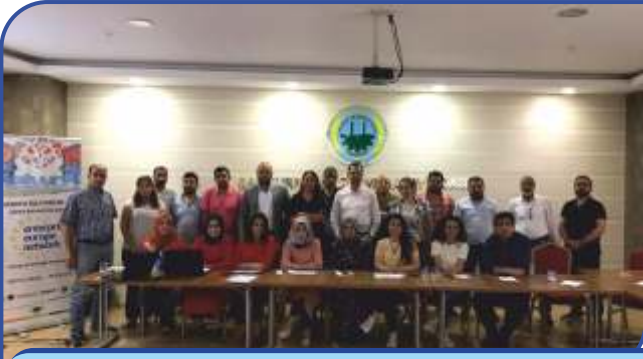
ULUSLARARASI HİBE PROJELERİ EđİTİMİ