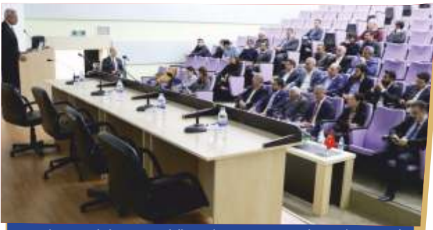
YENİLENEBİLİR ENERJİ ÜRETİM KOOPERATİFLERİ PANELİ