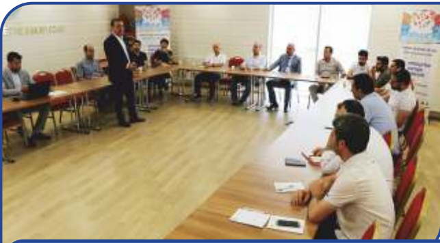
ULUSLARARASI TİCARET STRATEJİSİ EđİTİMİ