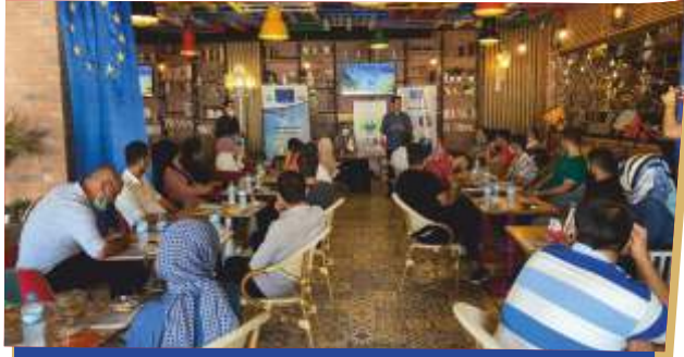
AB BİLGİ MERKEZİ "AB VE SİZ" PROGRAMI