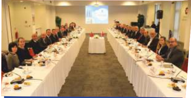
İSO İLE ORTAKLAŞA PAMUK ÇALIŞTAYI