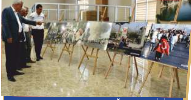
15 TEMMUZ KONULU FOTOĞRAF SERGİSİ