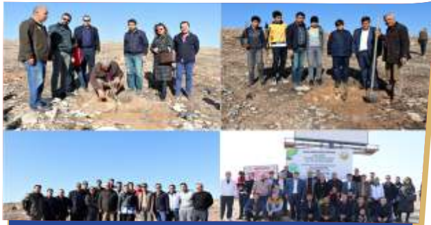
125. YIL ANISINA HATIRA ORMANI