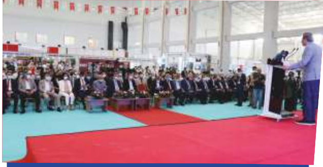
BÖLGESEL KALKINMA FORUM VE FUARI