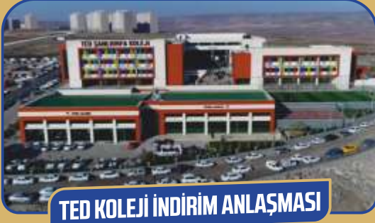
TED KOLEJİ İNDİRİM ANLAŞMASI