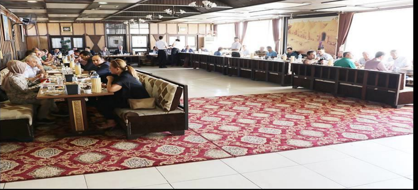
27.09.2018 tarihinde Sporyum Ocakbaşı'nda ŞUTSO Yönetimi, Meclis Üyeleri ve Yerel Basın Temsilcileriyle Basın Çalıştayı düzenlendi.